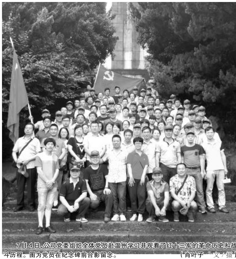
7 月 4 日，公司党委组织全体党员赴温州学习并观看了红十三军的革命历史和战斗历程。图为党员在纪念碑前合影留念。（肖叶子 文/摄）

6 月 29 日，董事长储吉旺应邀参加县第 7 届“方孝孺读书节”开幕式“寻找读书种子”启动仪式并接受宁海电视台关于如何读